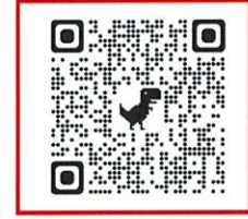
子育てひろば予約 QR コード