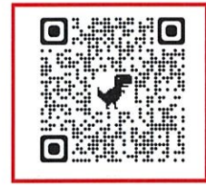
子育てひろば予約 QRコード